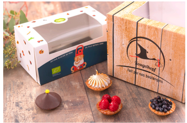
Boîtes à fenêtre